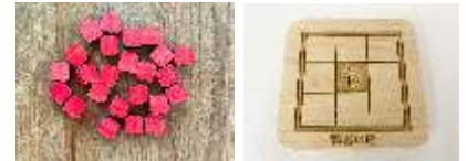
バランスストーン